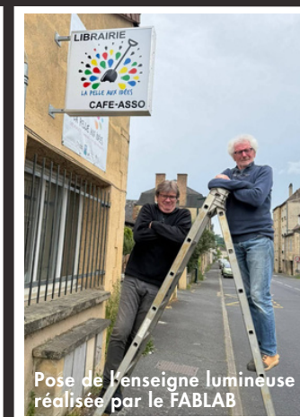
Pose de l'enseigne lumineuse réalisée par le FABLAB