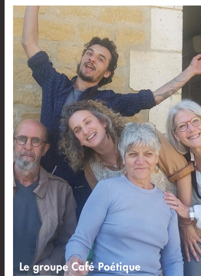
Le groupe Café Poétique

ATELIER INTERVENANT PROFESSIONNEL - PAYANT